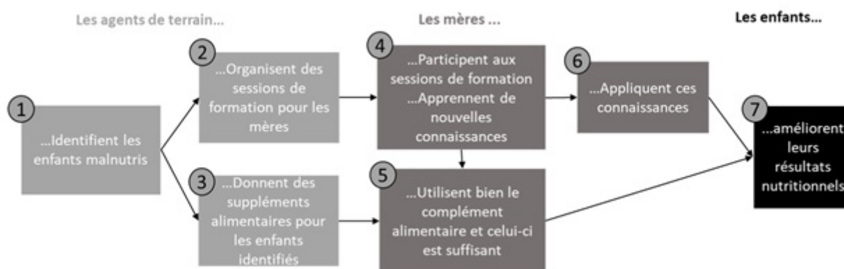
Théorie du programme alimentaire bangladais évalué

Parmi les exemples présentés, citons celui de « l'évaluation basée sur la théorie » (chapitre 20). Elle consiste à décomposer les différentes étapes de la chaîne causale liant l'intervention publique à ses résultats finaux, puis à tester empiriquement la validité de chaque maillon. Cette approche a été développée en réponse aux limites des démarches expérimentales ou quasi-expérimentales, qui permettent de mesurer les impacts d'une action, mais qui sont muettes quant à leurs mécanismes sous-jacents. Pour illustrer l'intérêt de cette méthode, l'auteure présente l'évaluation d'un programme alimentaire dédié aux enfants bangladais. Une première évaluation, utilisant des méthodes quasi-expérimentales (appariement sur score de propension), n'avait montré aucun effet du programme, sauf sur certaines catégories d'enfants. L'évaluation basée sur la théorie (figure ci-dessous) a permis d'en identifier les raisons : repérage imparfait des enfants malnutris par les agents en charge de la mise en œuvre du programme, mauvais ciblage du public, etc.