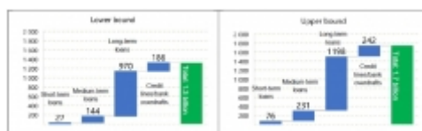
Déficit de financement du secteur agricole français par type de produit bancaire, 2017

Dans le cas de la France , plusieurs résultats intéressants se dégagent. Tout d'abord, le marché du crédit augmente dans le secteur agricole depuis plusieurs années, avec 52,7 milliards d'euros de prêts en 2018 contre 47,7 milliards en 2015. Néanmoins, les auteurs estiment qu'il existe un déficit de financement, entre 1,3 et 1,7 milliard d'euros, en dépit de conditions d'accès au crédit favorables et de taux d'intérêt bas. Les crédits sont inégalement répartis, 15 % des exploitations agricoles concentrant 65 % des volumes de prêts. Enfin, les nouveaux entrants et les jeunes agriculteurs connaissent un accès plus difficile au crédit, comme les porteurs des projets les plus innovants.